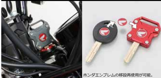
ホンダエンブレムの移設再使用が可能。

純正メインキーの樹脂部を取り除き、アルミ削り出しビレットキーカバーを取付け、スタイリッシュにドレスアップ。 ※装着にはキーの樹脂部を取り除きます。